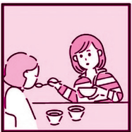
高齢の家族がいて、見守りや介護をしている。