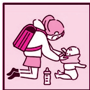
家事や幼いきょうだいの世話をしている。