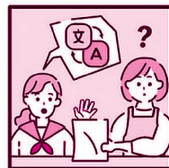
通訳等により、家族の意思疎通を支えている。